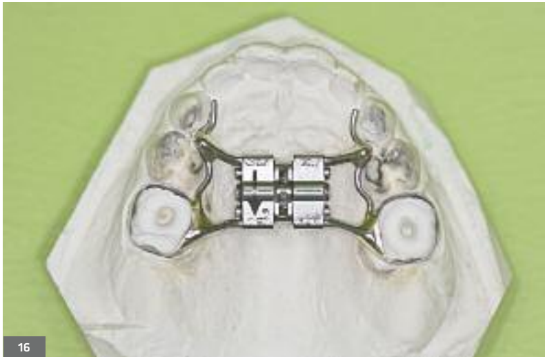
Fig. 16. Expansion fixe.