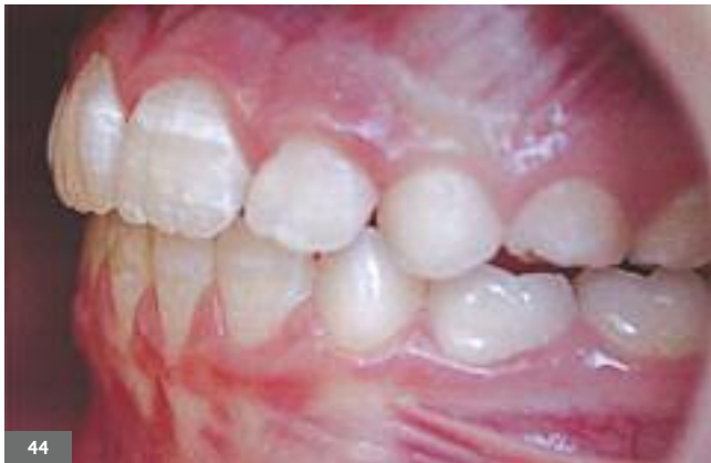
Fig. 37 - 44. Fin de traitement. Fig. 37 - 44. End of treatment.