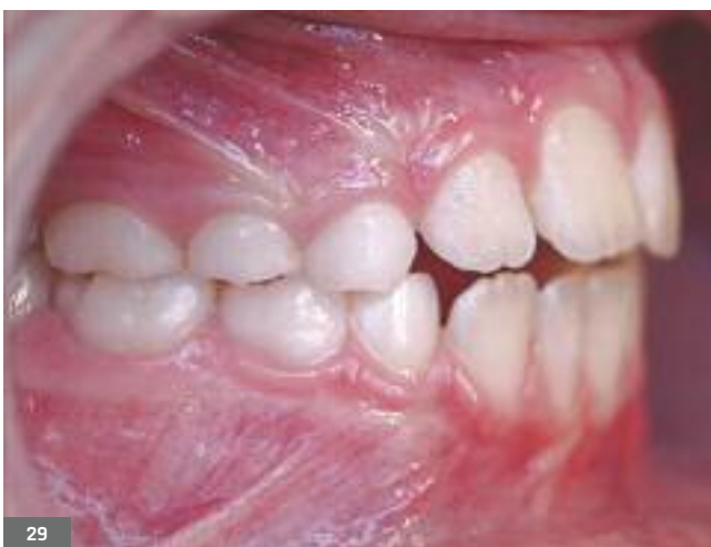
Fig. 25 - 30. Pictures after treatment: facial symmetry can be noticed, deviation of inter-incisal midlines has disappeared, open bite has been reduced.