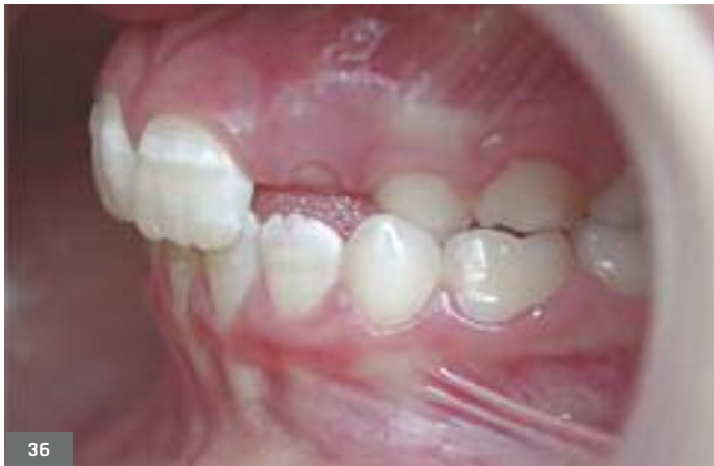
Fig. 21 - 36. Début de traitement.