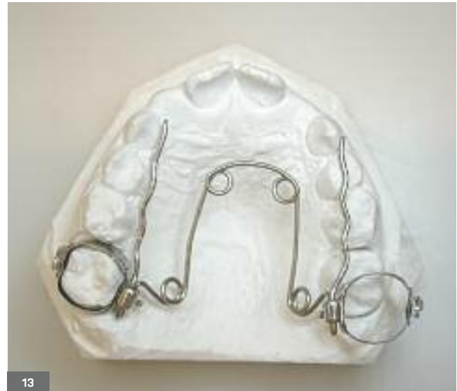
Fig. 12, 13. L'activation du quad hélix réalise une expansion et un mouvement distal des premières molaires.