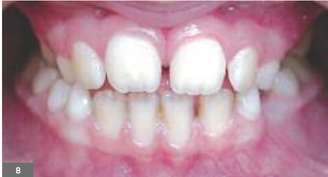
Fig. 8. Avant traitement. Fig. 8. Before treatment.

Clinical sign of this separation is the appearance of a diastema between maxillary central incisors, generally occurring at the end of the 3 rd day (fig. 8 and 9). This opening will be corrected later thanks to the elasticity of transseptal fibers.