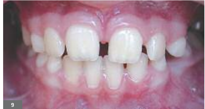
Fig. 9. Après traitement. Fig. 9. After treatment.

L'expansion maxillaire rapide a des effets également sur la mandibule qui tend à se positionner en bas et en arrière (Bishara et Staley, 1987). Selon Mac Namara, il existe également une augmentation de la largeur du plancher des fosses nasales (Mac Namara 2015).